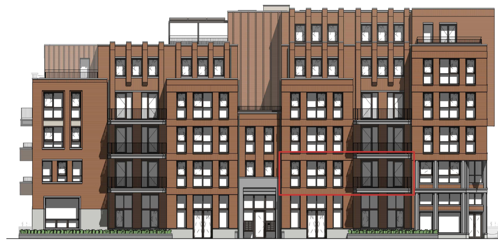
ENTREE GEVEL 1 : 200 Skopjestraat